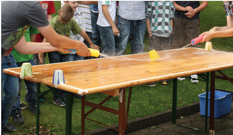
Eines der von den Bewohnern der Meißner Straße vorbereiteten Spiele

Sie berichtete außerdem, dass sich der Fokus auf ein kritisches Konsumverständnis erst später entwickelt habe. Zu Beginn stand die Festigung von kommunalen Beziehungen im Mittelpunkt des Projektes. Der Tauschprozess regt die Menschen dazu an, miteinander zu kommunizieren und sich auf einen Wert des Tauschobjektes zu einigen. Dieser Austausch findet, im Gegensatz zu herkömmlichen Verkaufssituationen, auf einer persönlicheren Ebene statt.